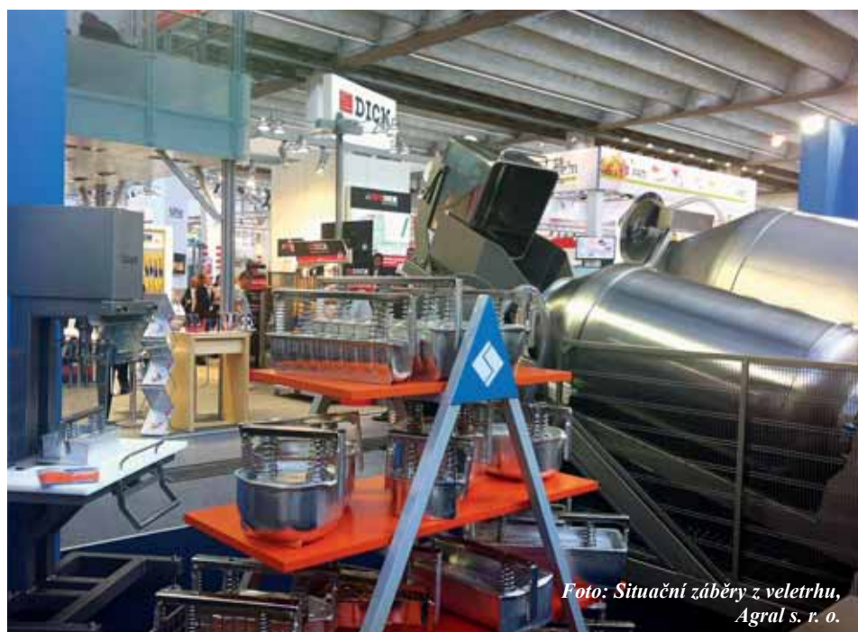
Foto: Situační záběry z veletrhu