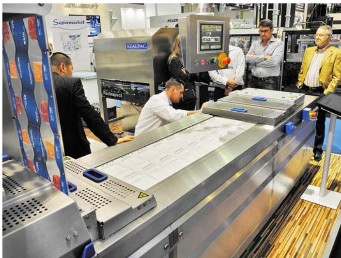
Obr. č. 2: Hlubokotažný balicí stroj SEALPAC RE20 s technologií ThermoSkin® na veletrhu Anuga FoodTec 2015

Hlubokotažné balicí stroje disponují řadou originálních řešení. RapidAir Forming System umožňuje zformovat ze spodní fólie podložní misku, aniž by bylo použito mechanického působení razníku. Vše zajišťuje horký vzduch spolu s působením tlakového vzduchu. Výhodou jsou zesílené rohy balení, zajištění bariérových vlastností a úspora materiálu. Chce-li zákazník baličky se snadným otevíráním, má k dispozici EasyPeelPoint. V oblasti hlubokotažných strojů stojí na vrcholu nabídky řada RE30. Tyto výkonné baličky zvládnou až 15 taktů za minutu, šířka použité fólie je mezi 285–680 mm, délka kroku může být 150–1000 mm. Maximální průtah fólie je 190 mm a délka samotného stroje kolísá podle provedení od 4,5 do 15,0 metru.